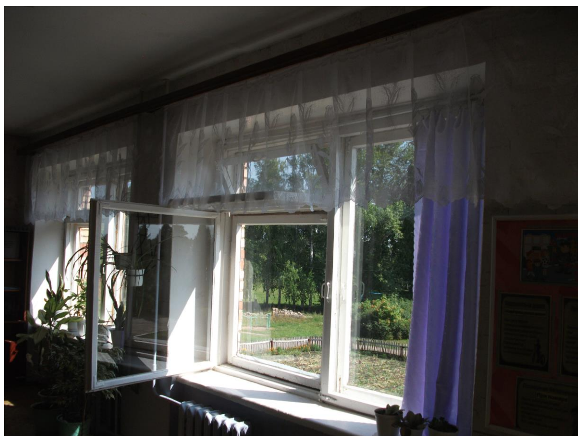
Кабинет начальных классов (1 класс)