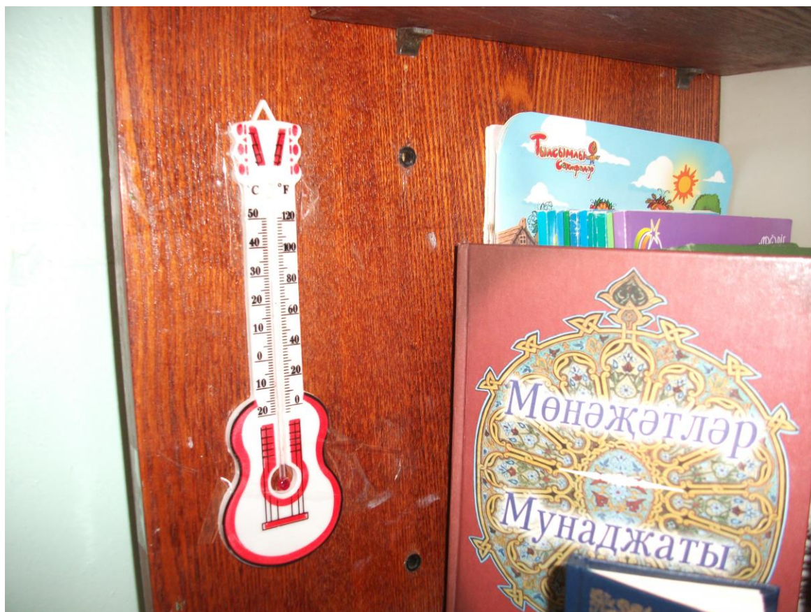
Кабинет татарского языка