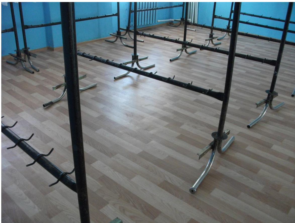
Гардероб с крючками для обуви