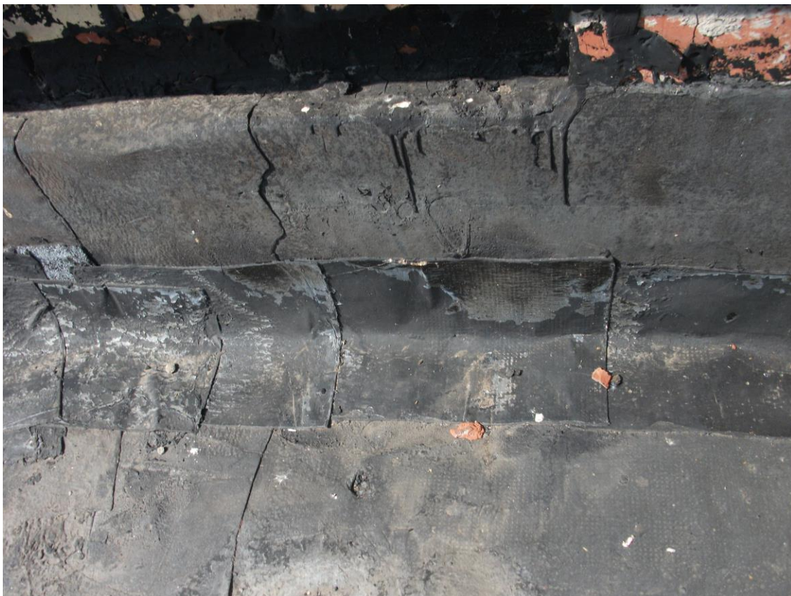
3 этаж кровля