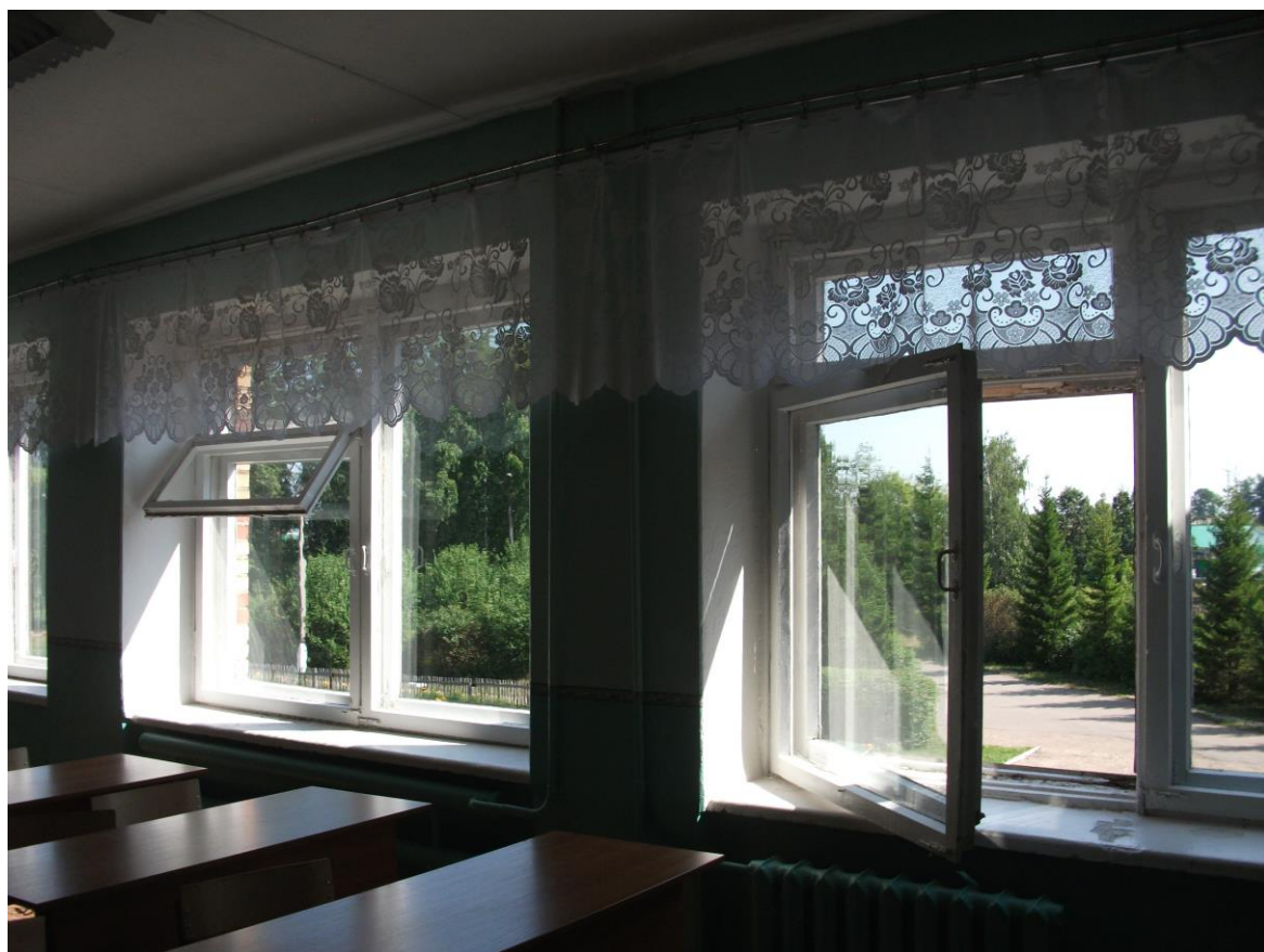
Кабинет татарского языка