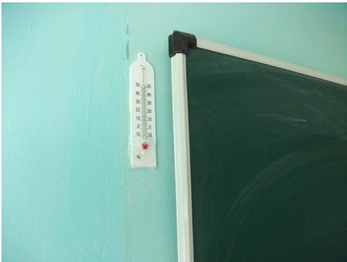
Кабинет русского языка