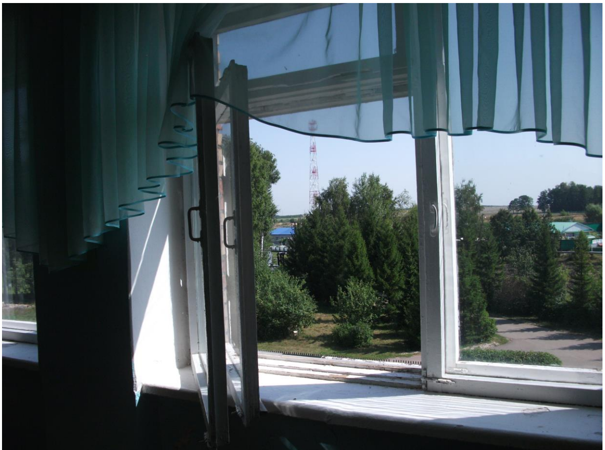
Кабинет русского языка