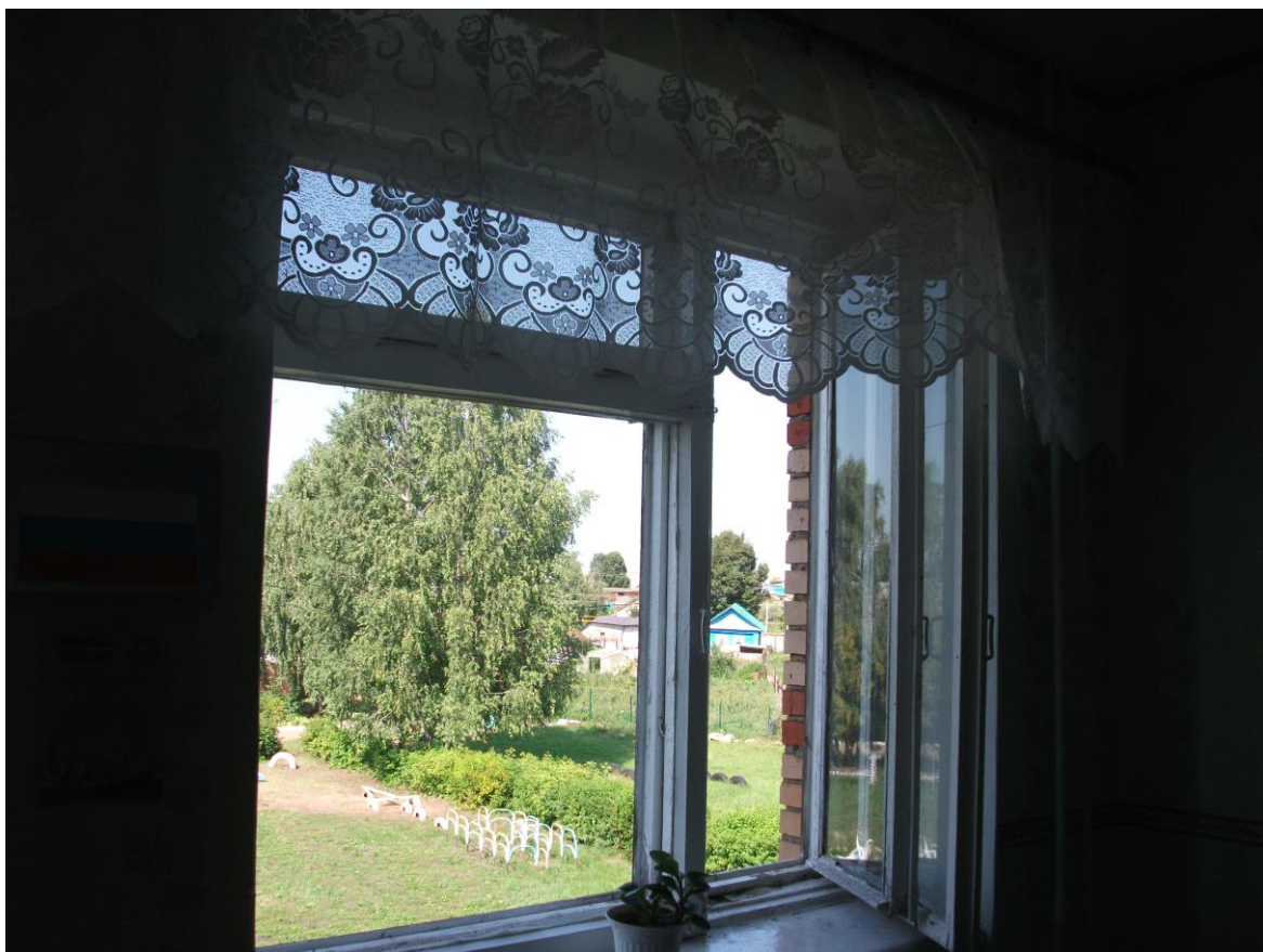
Кабинет русского языка