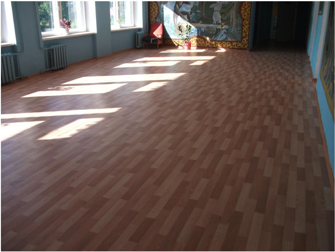
Кабинет 1 класса до ремонта